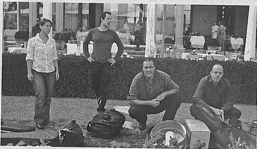
Die Celtic-Folk-Band «An Lár» spielt am Samstag im Dolder 2.

«An Lár» (Irisch für «das Zentrum») hat sich in den letzten Jahren schweizweit einen Ruf als stimmungsvolle und abwechslungsreiche Celtic-Folk-Band erspielt. Am Samstagabend tritt sie im Dolder 2 auf. Ihren Mix aus traditionellen und zeitgenössischen Tunes und Songs aus Irland, Schottland, Asturien, der Bretagne und Eigenkompositionen bringt die Band energiegeladene und stilvolle auf die Bühne. Neben den spannenden Arrangements zeichnet sich ein typisches «An Lár»-Konzert vor allem durch den starken Gesang und die grosse